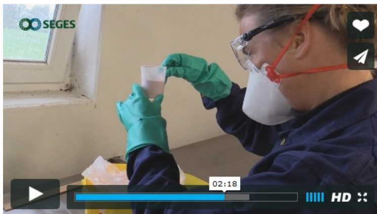
Sådan laver du en korrekt brugsopløsning